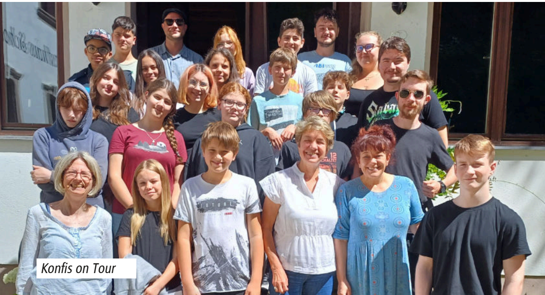
Konfis on Tour

Vorher noch ein „normales“ Treffen am Fr., 20.9. von 16 bis 18 Uhr in der Markuskirche zum Neustart im Herbst.